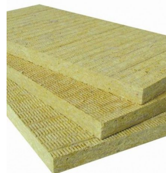
БАЗАЛЬТОВАЯ ВАТА (ПРОБНИК)

Цена: 13,000,000 UZS Вата, Строительные материалы Height (cm):400 Length (cm):120 Width (cm):250 Weight (kg):1000