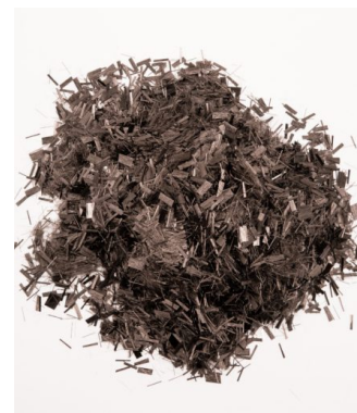
БАЗАЛЬТОВАЯ ФИБРА (ПРОБНИК)

Цена: 13,000,000 UZS Строительные материалы, Фибра Height (cm):400 Length (cm):120 Width (cm):250 Weight (kg):1000