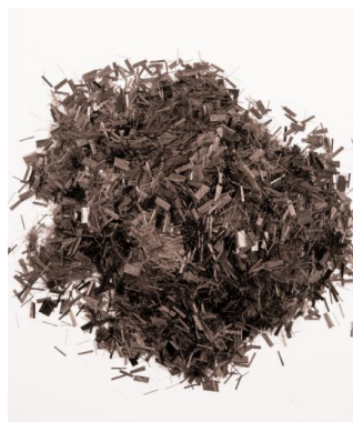
БАЗАЛЬТОВАЯ ФИБРА (1 ТОННА)

Цена: 0 UZS Ровинг, Строительные материалы Height (cm):15 Length (cm):15 Width (cm):20 Weight (kg):19