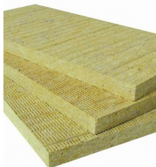
БАЗАЛЬТОВАЯ ВАТА (1 ТОННА)

Цена: 0 UZS Сетка, Строительные материалы Height (cm):15 Length (cm):15 Width (cm):20 Weight (kg):19