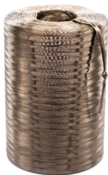
БАЗАЛЬТОВЫЙ РОВИНГ (ПРОБНИК)

Цена: 13,000,000 UZS Ровинг, Строительные материалы Height (cm):400 Length (cm):120 Width (cm):250 Weight (kg):1000